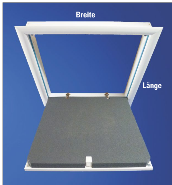
Abbildung: Deckentüre mit WärmeSchutz 3D.

inkl. Anschluss-System für dichte Ausführung der Einbaufuge