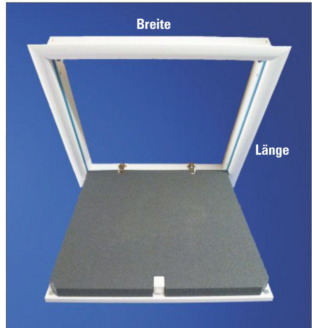
Abbildung: Deckentüre mit WärmeSchutz 3D.

inkl. Anschluss-System für luftdichten Einbau