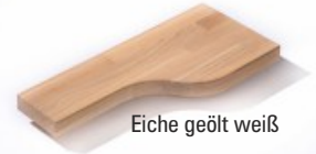
Eiche geölt weiß