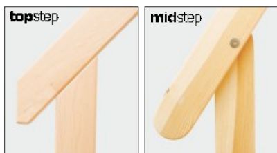
Geländer wangenbündig / angeschraubt