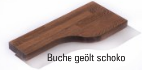
Buche geölt schoko