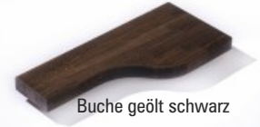
Buche geölt schwarz