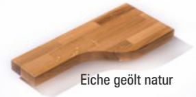
Eiche geölt natur