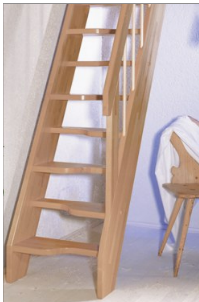
topstep mit geschwungenen Stufen; Geländer