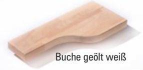
Buche geölt weiß