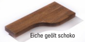
Eiche geölt schoko