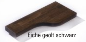
Eiche geölt schwarz