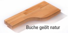
Buche geölt natur