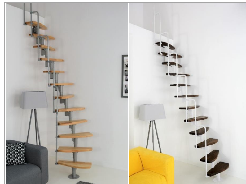
Monaco Buche grau Monaco beech grey