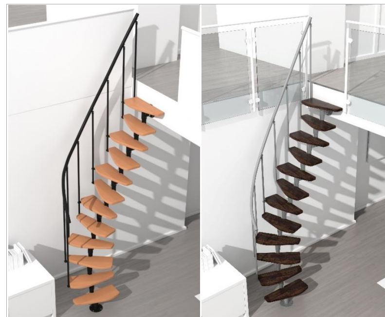
Monte Carlo Buche schwarz Monte Carlo beech black